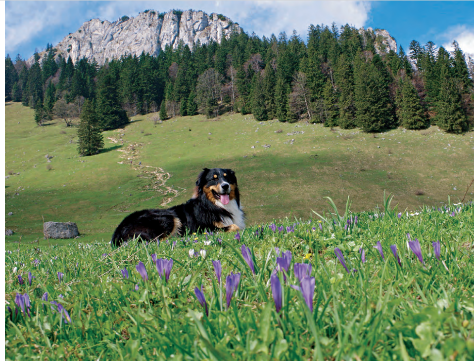
Violettes Blütenmeer vor der Kulisse der Wasserwand.

der Einfahrt des Parkplatzes waldwärts rechts am Zaun einer Kuhweide auf einem Waldpfad entlang. Von hier aus haben wir zum einen einen wunderbaren Blick auf das