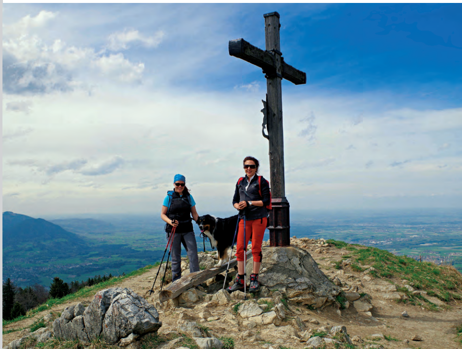
Tiefblick am Gipfelkreuz des Heuberg.

Wald die Kuppe des Heuberg. Rechter Hand bietet die Wasserwand einen kleinen Klettersteig (7) . Für geübte Bergwanderer ein lohnendes Aussichtsziel, allerdings kann ein Hund diesen Klettersteig nicht mitgehen. Linker Hand führt uns der Weg in etwa fünf Minuten zum Gipfelkreuz des Heuberg (8, 1337 m) . Der Rückweg vom Heuberg erfolgt erst über den gleichen Weg entlang der Aufstiegsroute bis zu den Daffnerwaldalmen (6) . Dort halten wir uns links und wählen zum Abstieg eine andere Route. Es geht zunächst linker Hand auf der geteerten Straße bergab. Gleich nach einem Kuhgatter biegt rechts eine ausgewaschene Abkürzung von der asphaltierten Straße ab, der wir in steilen Zickzackbahnen folgen können und die später auf den nicht zu übersehenden Wanderweg trifft. Leichter geht es von den Almen an der steilen Straße entlang auch zum breiten Wanderweg Richtung Parkplatz Schweibern/Duftbräu .